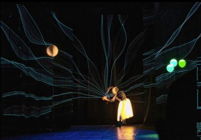
Fotos a la FIRA DE TITELLES de LIEIDA, TEATRE ESCORXADOR